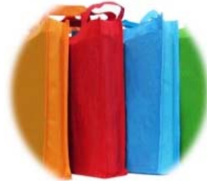
Figura 4: Saco em TNT spunbonded , 80g/m 2 .