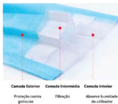
Fig. 1 - Estrutura genérica de uma máscara cirúrgica.

As máscaras cirúrgicas são essencialmente constituídas por tecido não tecido (TNT) de polipropileno, com densidade entre 18 e 25g/m 2 , disposto em 3 camadas ( spunbonded-meltbrown-spunbonded ); sendo que a camada intermédia de TNT funciona como um filtro (figura 1) (14).